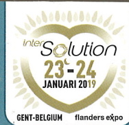
InterSolution p. 4